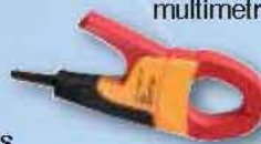
Proudové kleště i400