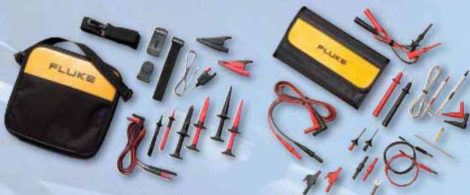
TLK289 Sada průmyslových měřicích kabelů

K dispozici je široký výběr příslušenství, pomáhající při zvyšování produktivity měření multimetry Fluke 289 a Fluke 287. Následující je ale pro většinu uživatelů nepostradatelné.