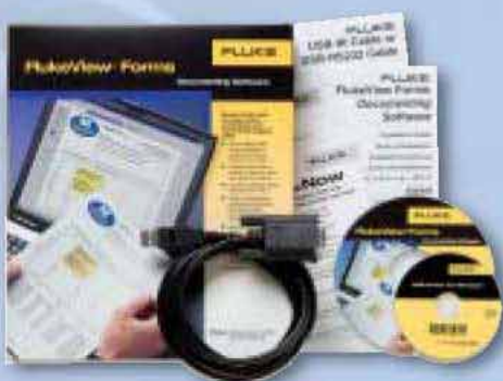
FlukeView® Forms Software a kabel