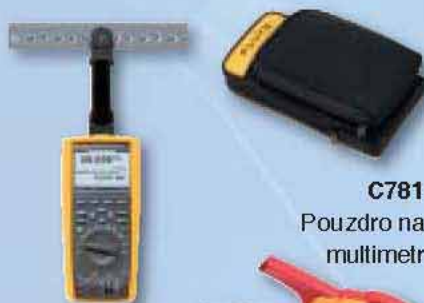
TPAK Magnetický závěs